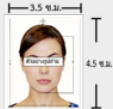
ตัวอย่างขนาดรูปถ่ายที่ตรงตามสถานทูตกำหนด

ความกว้างของใบหน้า 2.5 เซนติเมตร แต่ไม่เกิน 3 เซนติเมตร