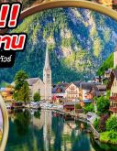
พิเศษ!! พัก Hallstatt หรือ St.Wolfgang ริมน้ำทะเลสาบ 1 คืน

พิเศษ สัมลองเมนูประจำชาติ ทั้ง 5 ประเทศ!!!